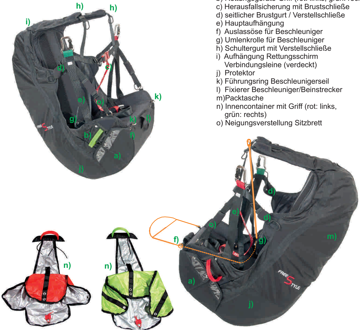
1) Schematische Darstellung Einbau Beschleuniger (Bauteile teilweise innenliegend verdeckt)